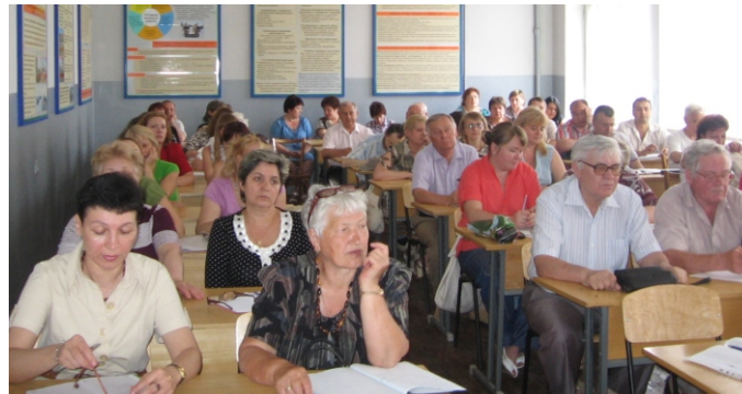
Виїзне засідання профспілкового комітету