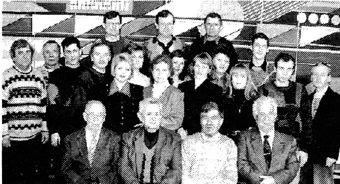
Коллектив отдела ТСО