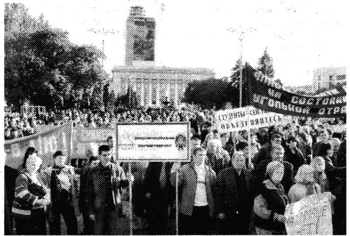
7 жовтня акція протесту профспілок відбулася і у Донецьку

Акція протесту продемонструвала єдність і готовність домогтися від влади і роботодавців встановлення в Україні гідних і безпечних умов праці, її соціально справедливої оплати, а також достойного соціального забезпечення ветеранів, молоді, жінок, рішучість українців подолати бідність і забезпечити собі та своїм родинам кращі умови життя