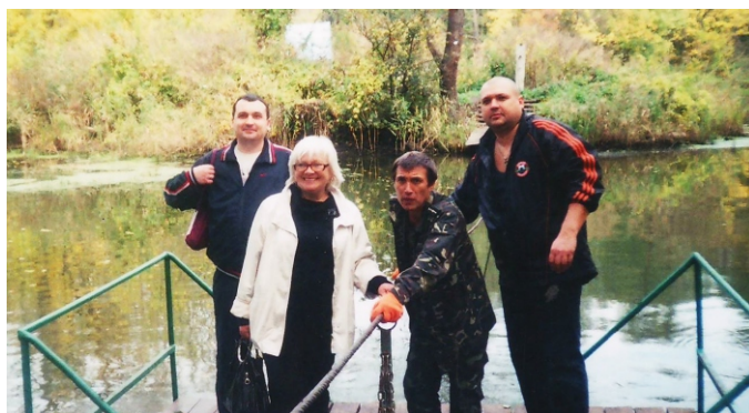
Сотрудники Донецкого лицея «Коллеж» во время поездки «выходного дня»

ту, соблюдением администрацией лицея порядка привлечения педработников в выходные дни. Они привлекаются к работе лишь в период проведения олимпиад с компенсацией за отработанное время в каникулярный период.