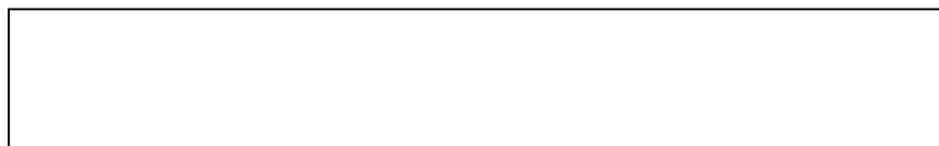
Рисунок 1 – Структурна схема дорожнього контролера

Приклад оформлення рисунків у тексті (рис.1):