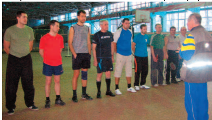
Инструктаж перед началом соревнований