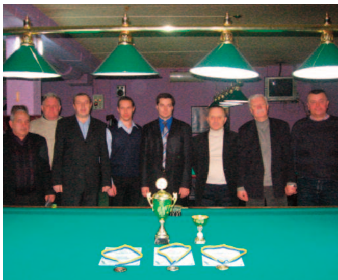
Призы ждут своих героев