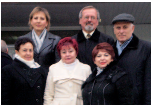
Делегати з'їзду від профспілкових організацій області