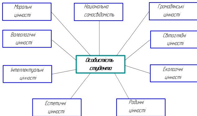
Концептуальна модель особистості студента

Таким чином, головною метою виховання на сучасному етапі є передача молодому поколінню соціального досвіду, багатств духовної культури народу, його соціальної ментальності, своєрідності світогляду. На цій основі формуються особистісні риси громадянина-патріота України, які включають в себе національну самосвідомість, розвинену духовність, моральну, художньо-естетичну, правову, трудову, фізичну, екологічну культуру, розвиток індивідуальних здібностей і таланту. Саме тому національна спроможність освіти, як наголошується у Державній національній програмі «Освіта (Україна XXI століття)» - полягає у невіддільності її від національного ґрунту, її органічному поєднанні з національною історією і народними традиціями, збереженні та збагаченні культури українського народу.