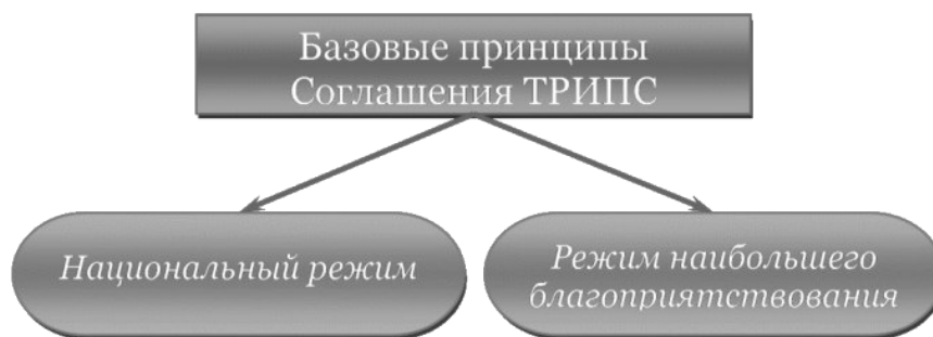
Рис. 1. – Базовые принципы ТРИПС

Парижская конвенция строится на двух основополагающих принципах (Рис. 1).